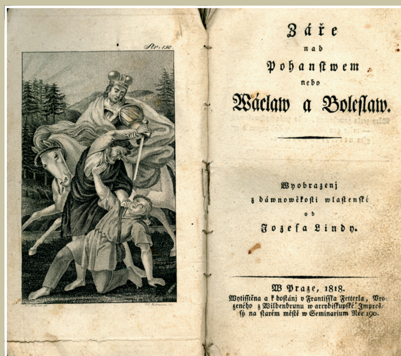
Titulní list prvního vydání Záře nad pohanstvem (1818) ze sbírek Národního muzea. Ve frontispisu výjev zavraždění sv. Václava bratrem Boleslavem (ryl Vincenc Gottmann)